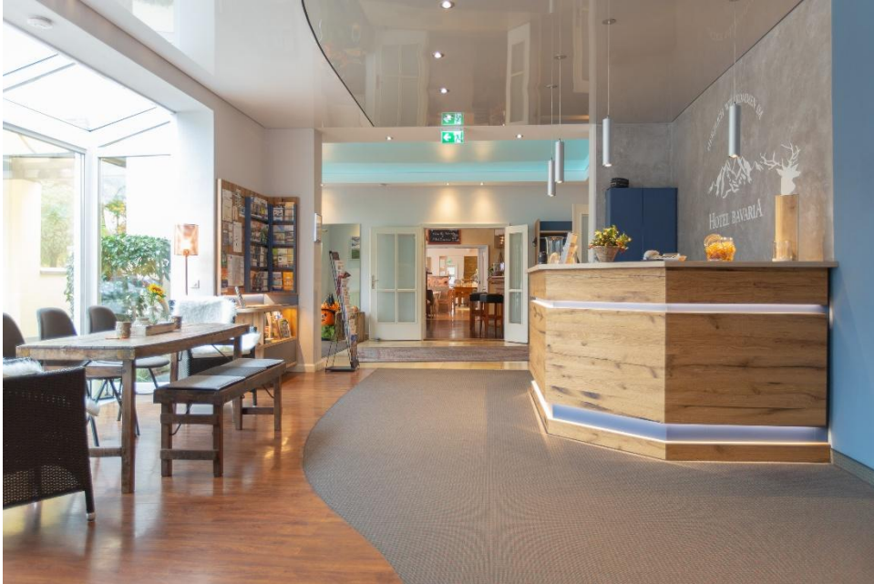
Empfangsbereich des AKZENT Hotel Bavaria Oldenburg