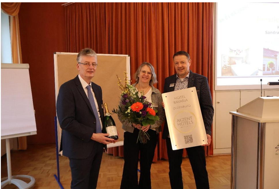
AKZENT Hotels heißen ihr neues Mitglied willkommen